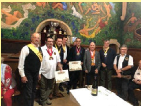
Adoubements au Cellier de la Vieille Eglise