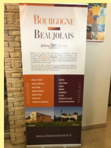
de quoi déguster...